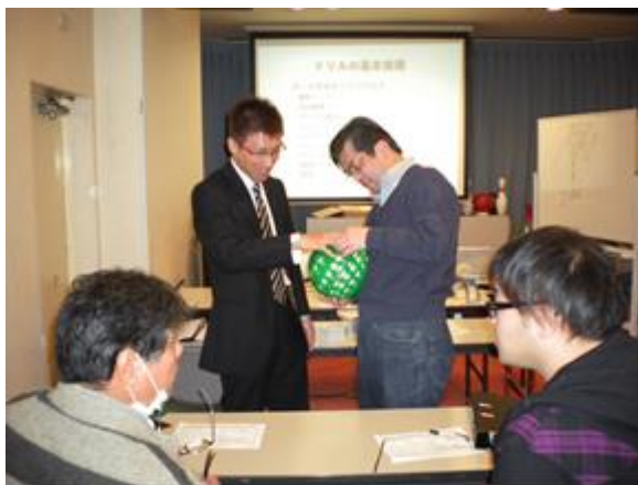
スパン等測定風景